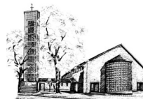
St. Elisabeth (EI) Elisabeth-Breuer-Str.