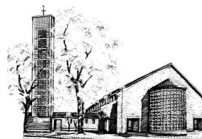
St. Elisabeth (EI) Elisabeth-Breuer-Str.