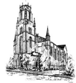
Herz Jesu (H) Danzierstr.